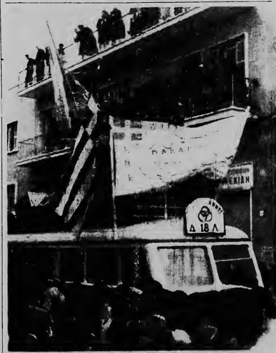
Ora cu a yega na Cyprus e noticia di e arreglan na Londen pa forma un Republica Cypriota, nan a cuminsa liberta e presonan na e isla. E tolototo aki ta duna un idea con un bus cu algun presonan cu a hanja nan libertad tabata corre door di e capital Nicosia baw di gritonan di alegria. Riba e bus tin bnderanan cu clogio skirbi ariba dedica na Mgr. Makarios.